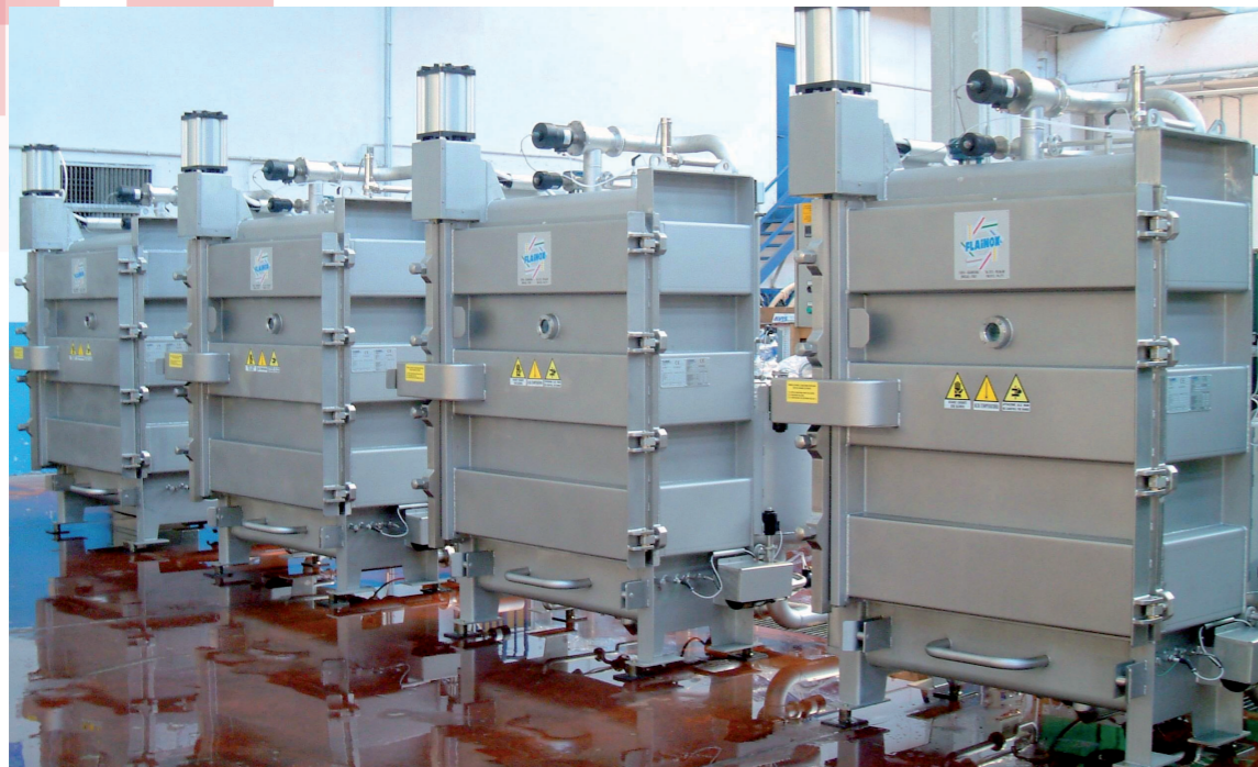
Vista di alcuni impianti View of certain plants Vista de algunas instalaciones 设备视图