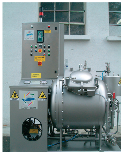
ARC/HT/8 KG con pre-centrifuga ARC/HT/8 KG with pre-centrifuge

ARC/HT: è ideale per campionature di laboratorio e piccole produzioni. Le sue caratteristiche costruttive e di lavoro corrispondono a quelle delle macchine di maggiore capacità per garantire un'ottima riproducibilità del colore. E' la più versatile in quanto consente tinture sino a 135°C.