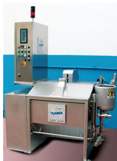
ARC/8 KG con pre-centrifuga ARC/8 KG with pre-centrifuge

Para todas las capacidades flexibilidad hasta el 50% de carga nominal a relación de baño constante.