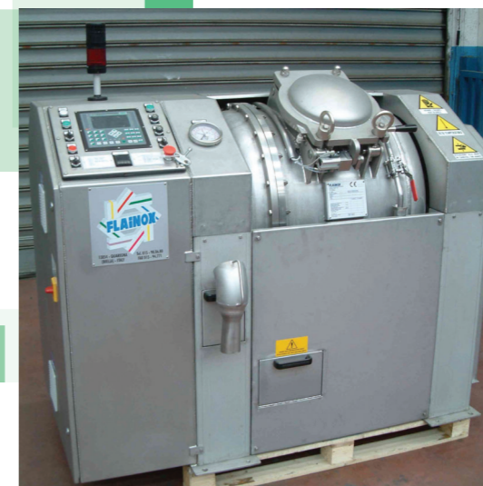
ARC/HT/8 KG con centrifuga ad alta velocità. ARC/HT/8 KG with high-speed centrifuge.

ARC/HT: 是用于小批量生产运行的实验室取样的理想设备。其构造与运行功能与大容量设备的构造与运行功能一致，因而可确保优良的色彩复制。由于其允许在高达 135°C 的温度下进行染色，因此该设备同样具有多功能特性。