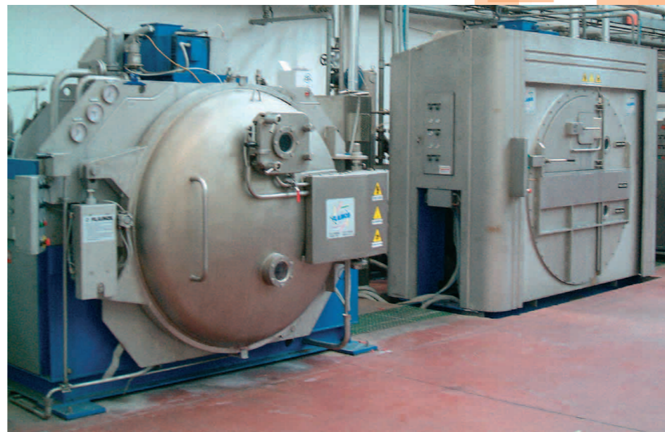
Vista di alcuni impianti