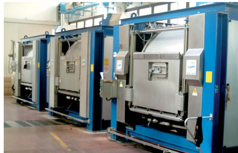
Vista di alcuni impianti View of certain plants Vista de algunas instalaciones 设备视图